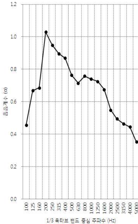
[그림 4] 음향계수 주파수 특성