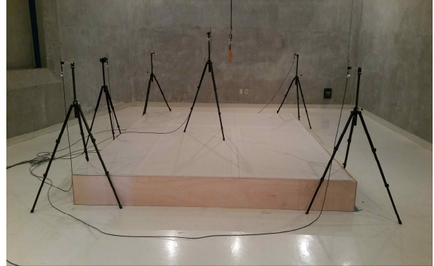
[그림 3] 시험체 설치모습